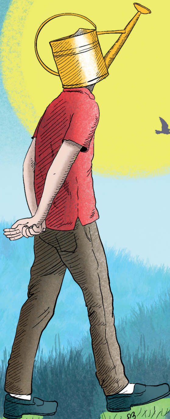
Illustrazione di Mariagrazia Colace

teatro musica danza circo incontri La pazienza del coltivare